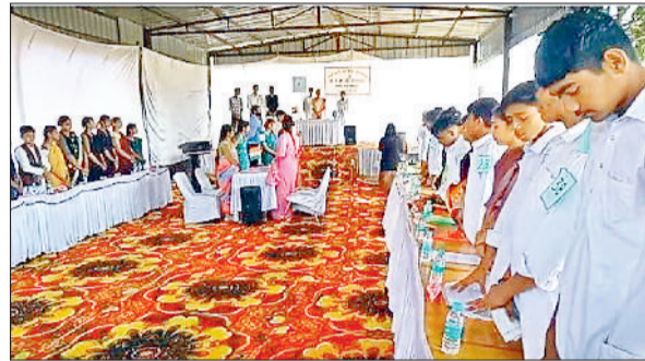
अंबाला। युवा संसद के दौरान मीजूद छात्र।

अब दोबारा से टैंडर लागू होने और बूम बैरियर शुरू होने के बाद भी शिकायतें आना यह दर्शाता है कि समस्या अब भी बरकरार है। शिकायत सामने आने के बाद रेलवे प्रशासन तुरंत हस्तकत में आ गया। सीनियर डीसीएम नवीन इरॉ ने बताया कि शिकायत की जांच शुरू कर दी गई है। उन्होंने कहा कि अगले जॉब में पार्किंग स्टाफ की गलती गई होगी तो उसके खिलाफ सख्त कार्रवाई की जाएगी। यात्रियों को सुविधा हदामती प्राथमिकता है। किसी भी प्रकार की बदसलूकी बर्बर नहीं की जाएगी।