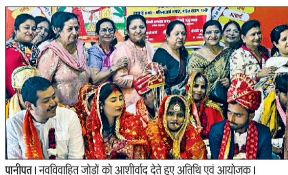
पानीपत। नवविवाहित जोड़ों को आशीर्वाद देते हुए अतिथि एवं आयोजक।

है को सार्थक करने में समिति पूरा योगदान दे रही है। समाज में बहुत से परिवार आर्थिक तंगी के चलते अपनी बेटियों को शादियां करने में असमर्थ हैं। इसलिए समिति द्वारा हर वर्ष जरूरतमंद कन्याओं की शादियां करवाई जाती हैं। इसके अलावा फ्री