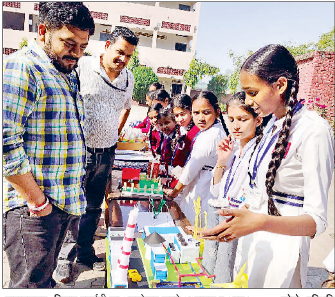
नारायणगढ़। विज्ञान प्रदर्शनी का अवलोकन करते अध्यापक व अन्य।