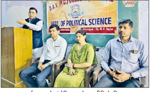
करनाल। कार्यशाला को संबोधित करते राजनीति के विद्वान।