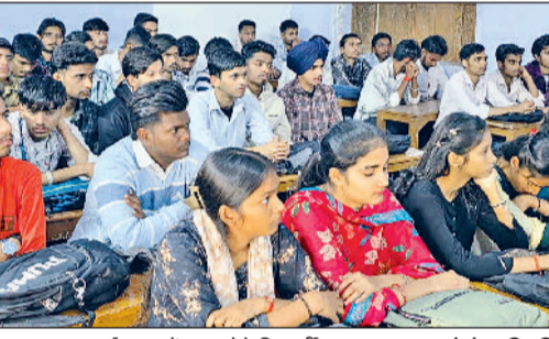
करनाल। कार्यशाला में भाग लेते विद्यार्थी।