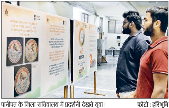
पानीपत के जिला सचिवालय में प्रदर्शनी देखते युवा।

प्रदर्शनी युवाओं को अपने इतिहास, संस्कृति और स्वतंत्रता संग्राम की अमर गाथाओं से जोड़ने में महत्वपूर्ण भूमिका निभाती है