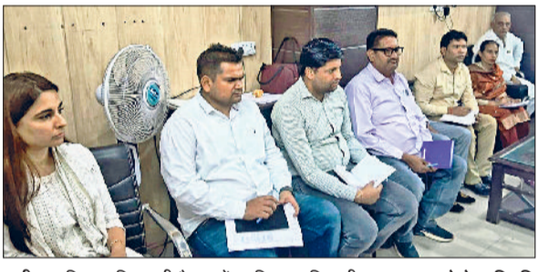
पानीपत। जिला परिषद की बैठक में उपस्थित अधिकारीगण।

कबराला से नौल्था तक अब बदलेंगे गांवों के हालात